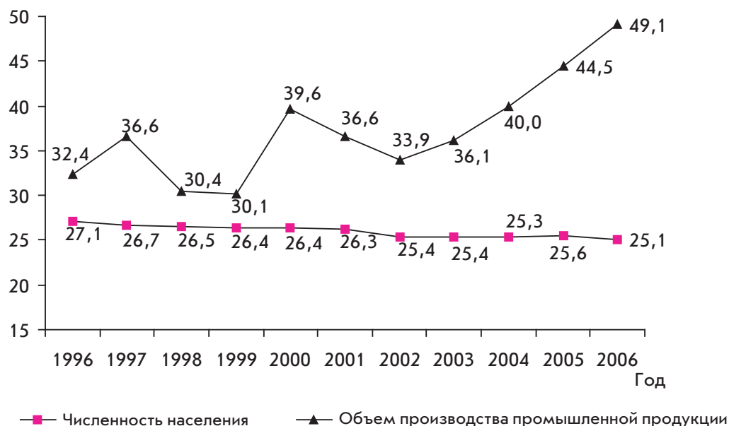
Рис. 2. Динамика удельного веса численности населения и объемов производства промышленной продукции северных территорий Иркутской области в 1996–2006 гг., % (данные территориального органа Федеральной службы государственной статистики по Иркутской области)