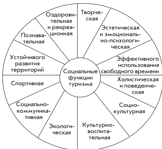
Рис. 1. Социальные функции туризма

Социальная сущность туризма может быть раскрыта через определение социальных функций, число которых значительно: