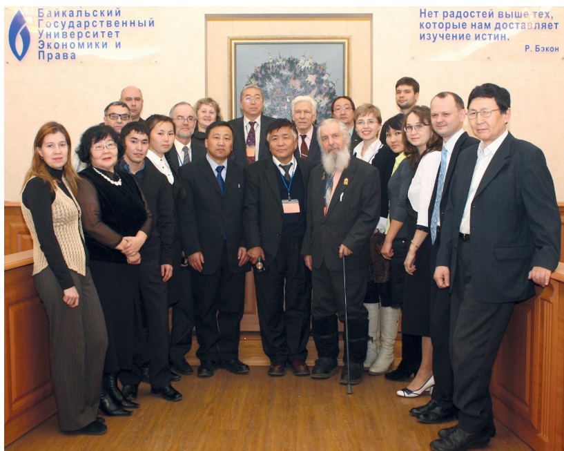
Участники международной научной конференции «Монголия в XX веке: 1911–2011 гг.». г. Иркутск, БГУЭП, 1 декабря 2011 г.