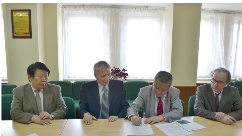
Руководители российско-монгольского международного проекта БГУЭП и Академии наук Монголии во время рабочего совещания в Улан-Баторе, 17 мая 2013 г.