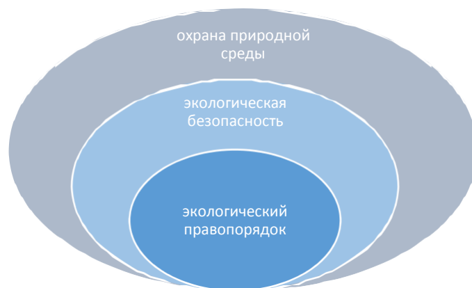
Рис. 1. Соотношение понятий «экологическая безопасность», «экологический правопорядок» и «охрана природной среды» по объему

В целом, соотношение представленных понятий по объему наглядно продемонстрировано на рис. 1.