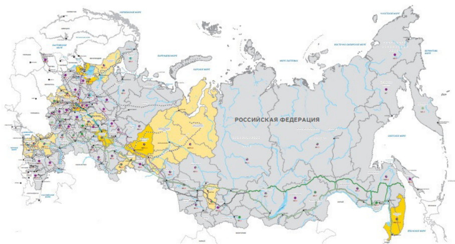
Рис. 2. Карта развитости инфраструктуры РФ

Самой главной проблемой для страны, помимо вышеупомянутого обострения международных отношений, является неравномерность развитости инфраструктуры.