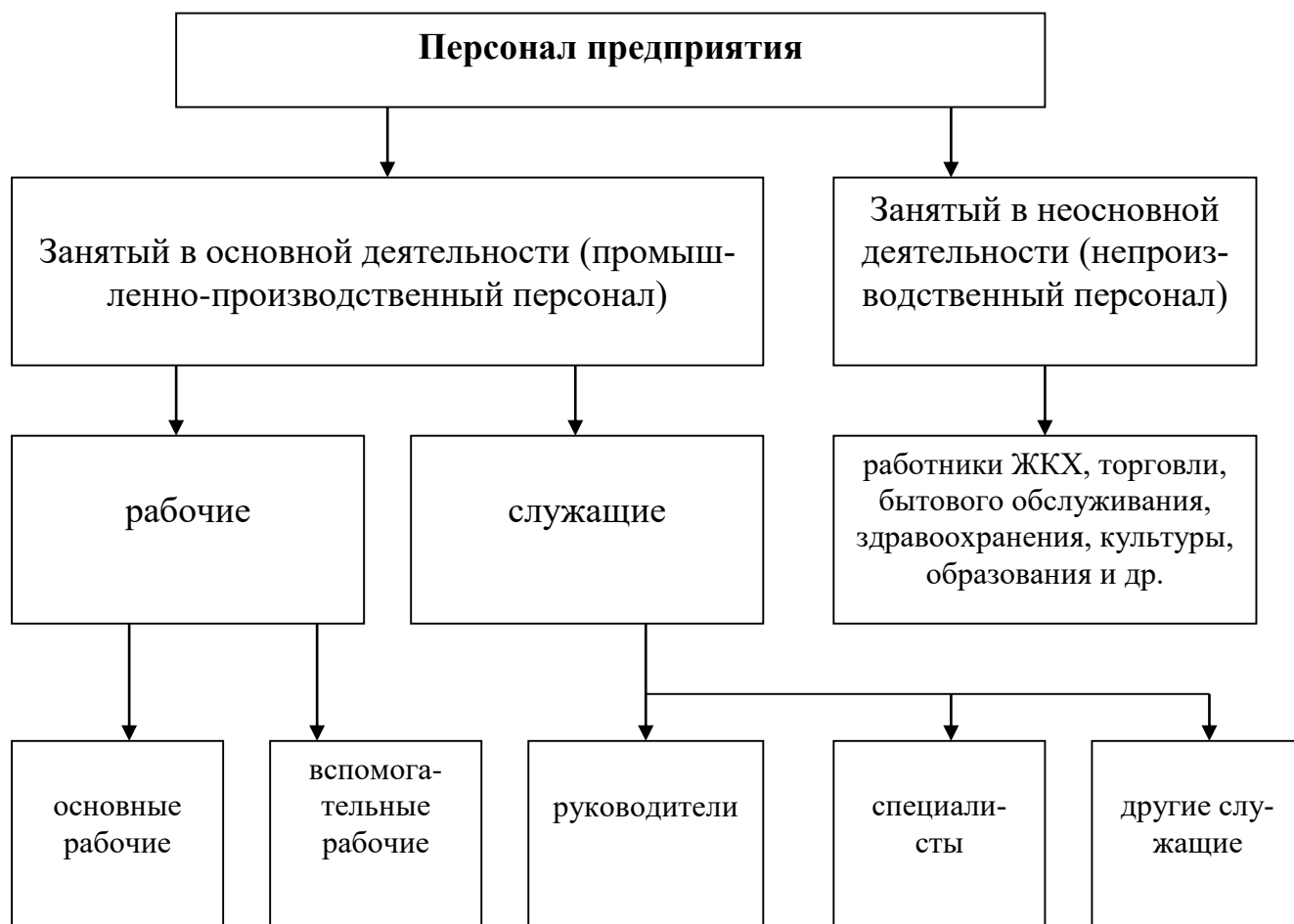
Рис. 3. Состав и структура персонала предприятия

которое необходимо для анализа состава и структуры кадров. Профессия отражает род трудовой деятельности, в которой занят тот или иной работник (например, токарь, слесарь, экономист, инженер и т.д.). Специальность выделяется в рамках профессии и характеризует более узкий вид трудовой деятельности, непосредственно связанный с той работой, которую выполняет какой-либо работник (например, слесарь-наладчик, слесарь-инструментальщик и др.).