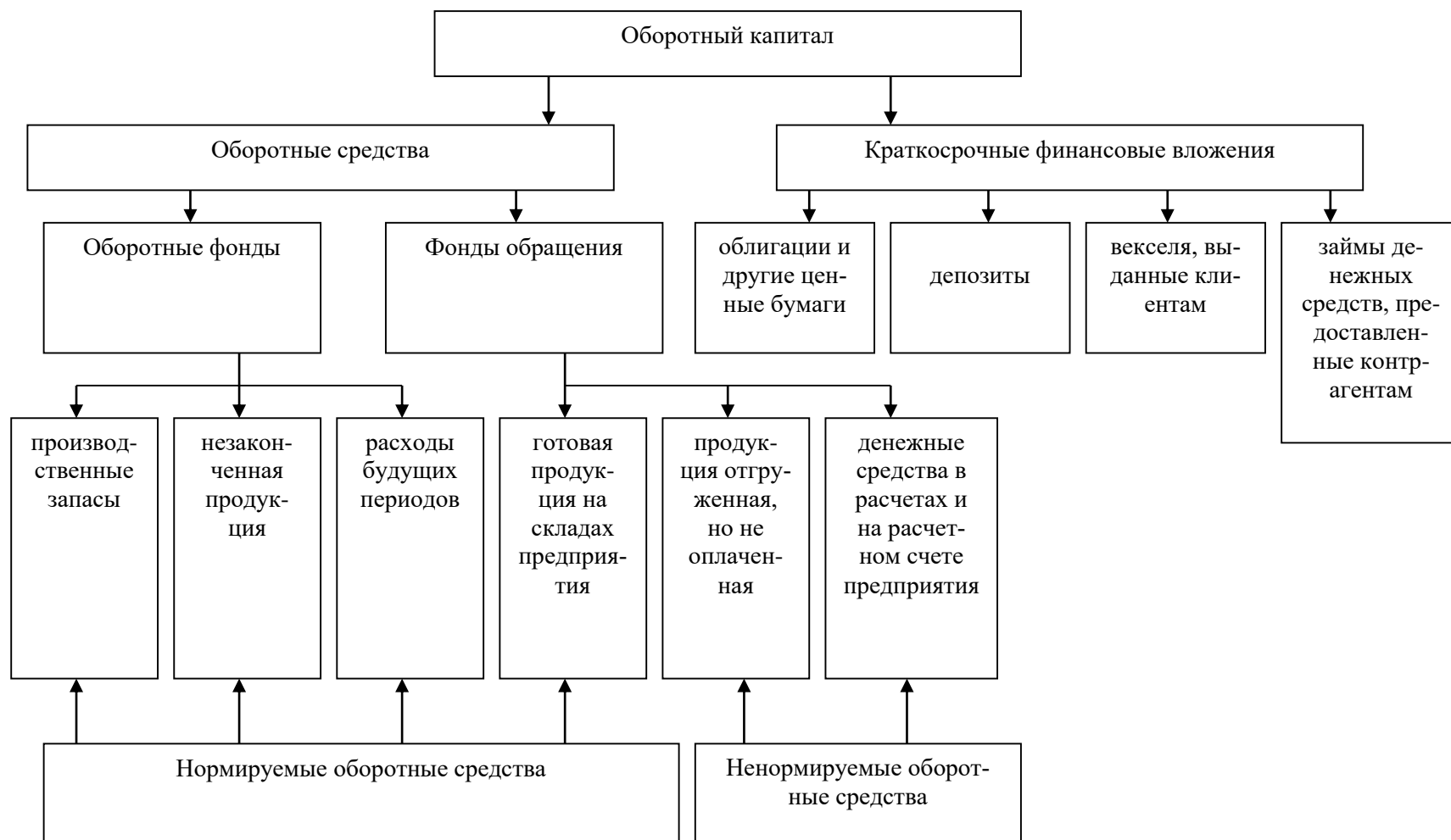
Рис. 2. Состав и структура оборотного капитала предприятия