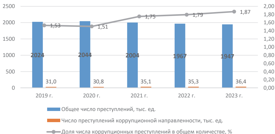
Рис. 1. Динамика зарегистрированных в России преступлений коррупционной направленности

В России численность зарегистрированных преступлений ежегодно сокращается. Это наглядно видно по данным рис. 1.