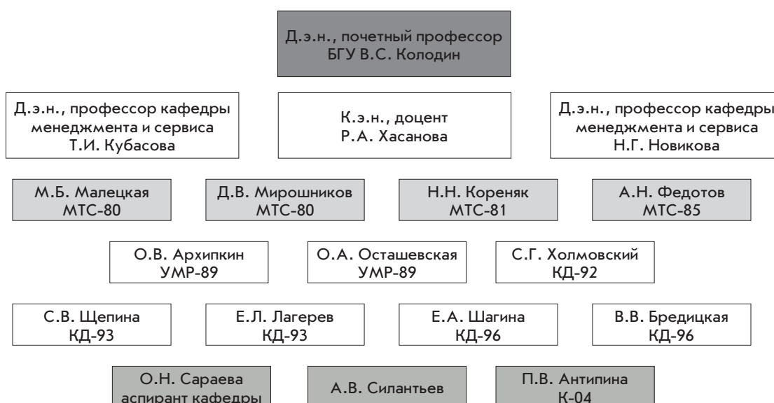
Рисунок 3. Древо направления подготовки «Торговое дело»