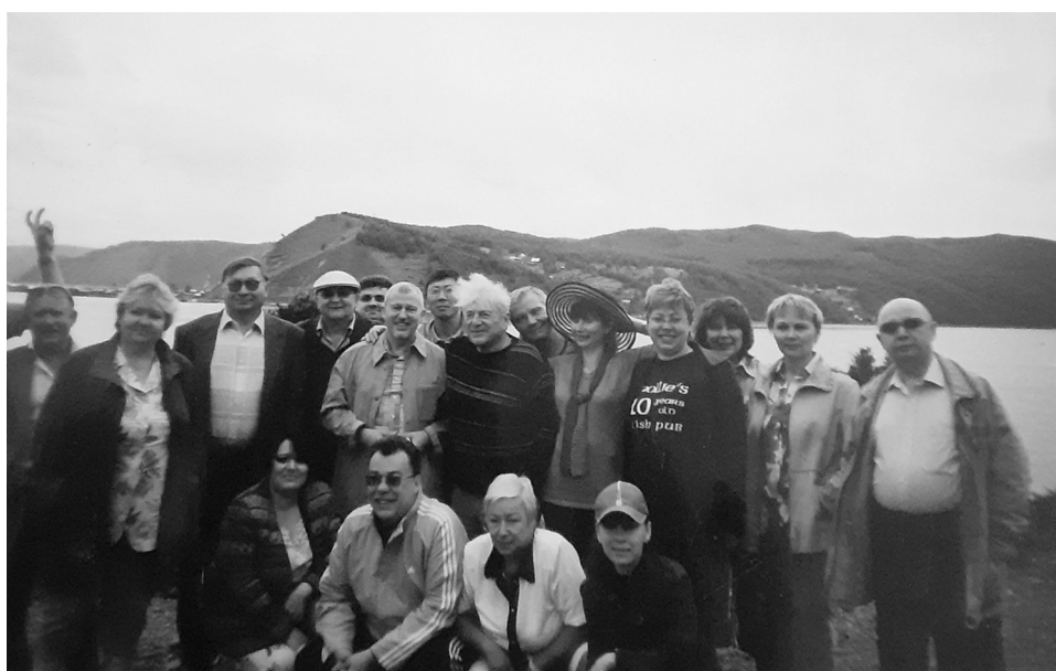
Рис. 2. Участники международной научно-практической конференции «Логистические принципы в организации товародвижения в регионе» (2006 г.)